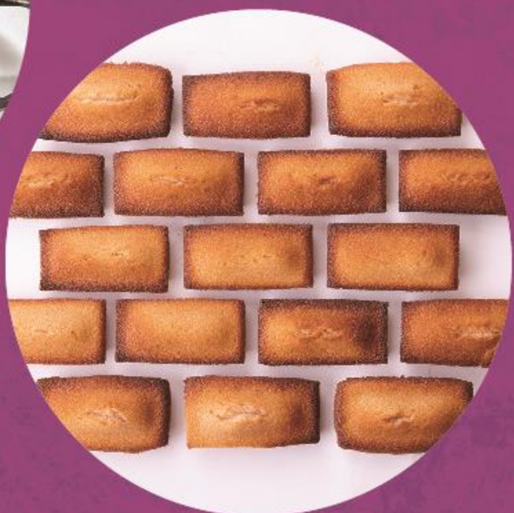
はこだてみなと大学 サカナ学部 (焼き菓子等)