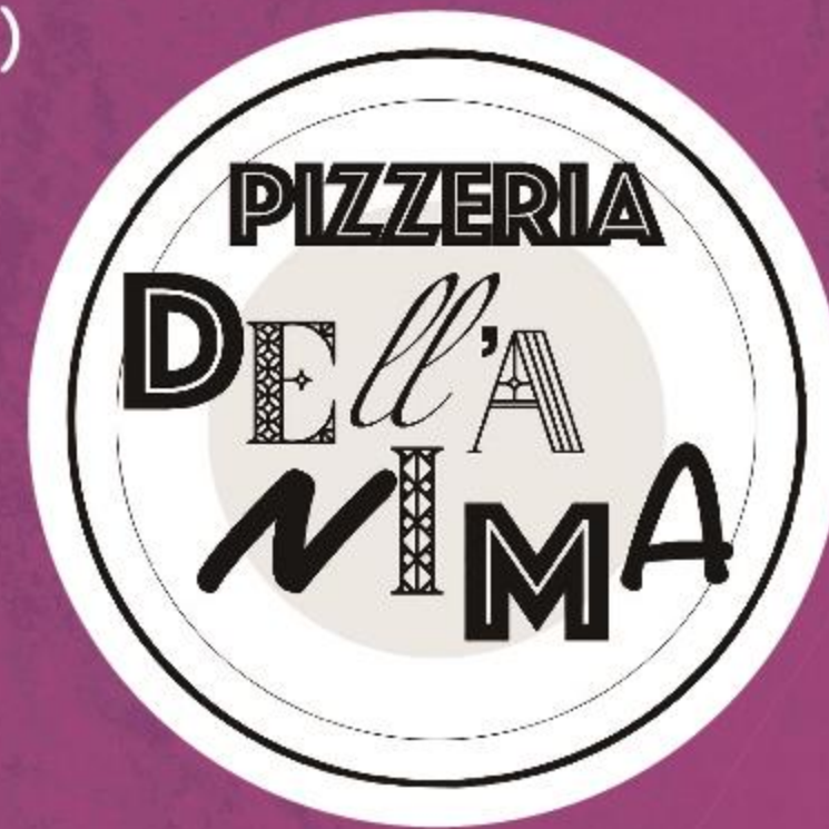
PIZZERIA DELL'ANIMA (ピザ)