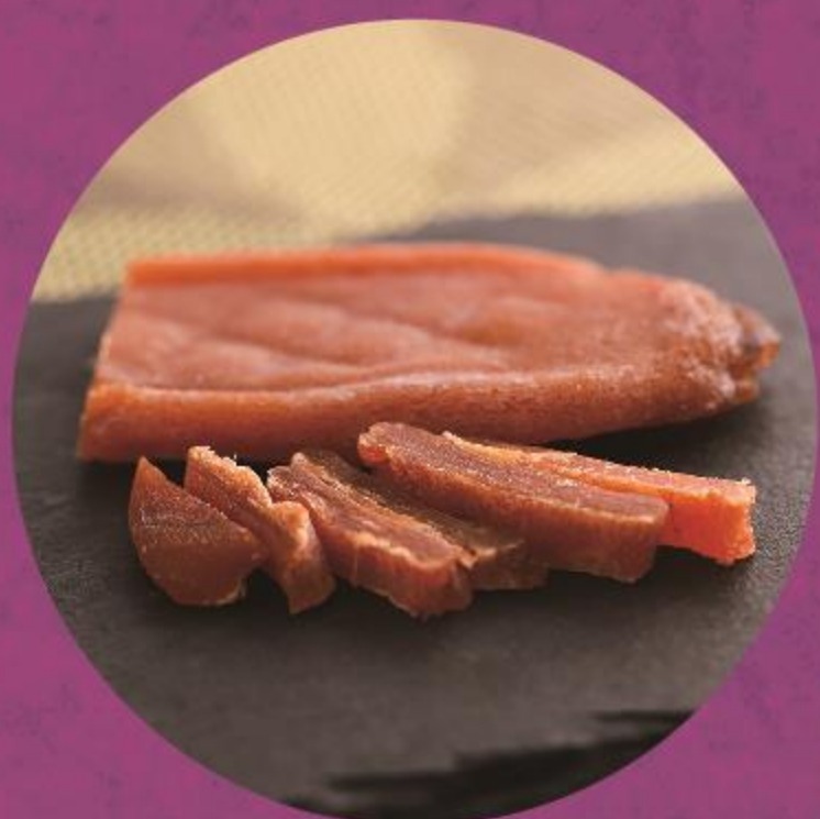
一印 高田水産 (海鮮珍味)