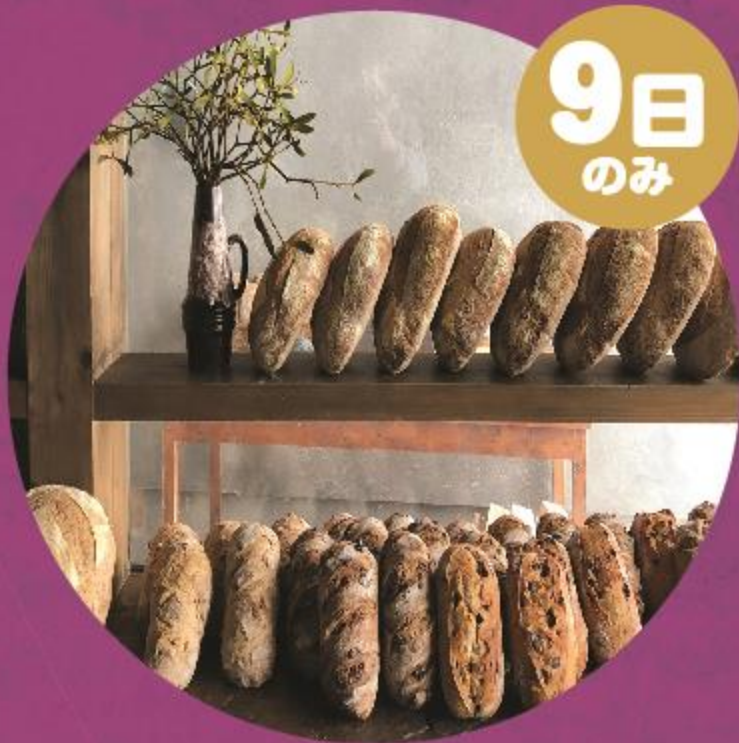
天然酵母パン tombolo (パン)