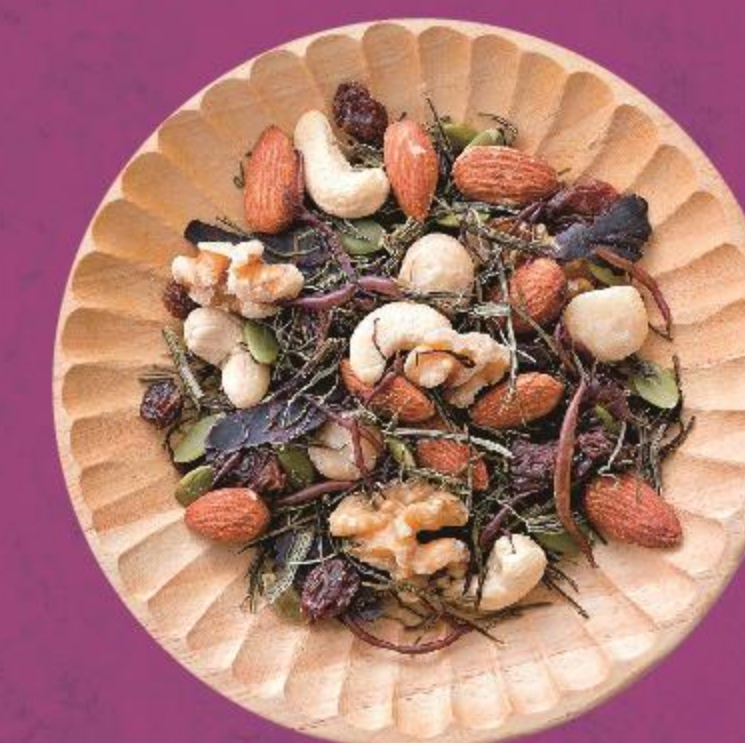
昆布村 (ナッツと昆布)