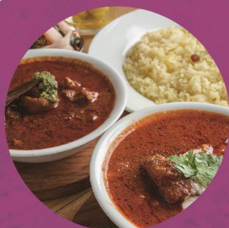
ハッチャギ currybar (惣菜)