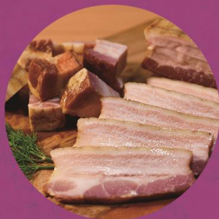
Wise man's FPL (ベーコン)