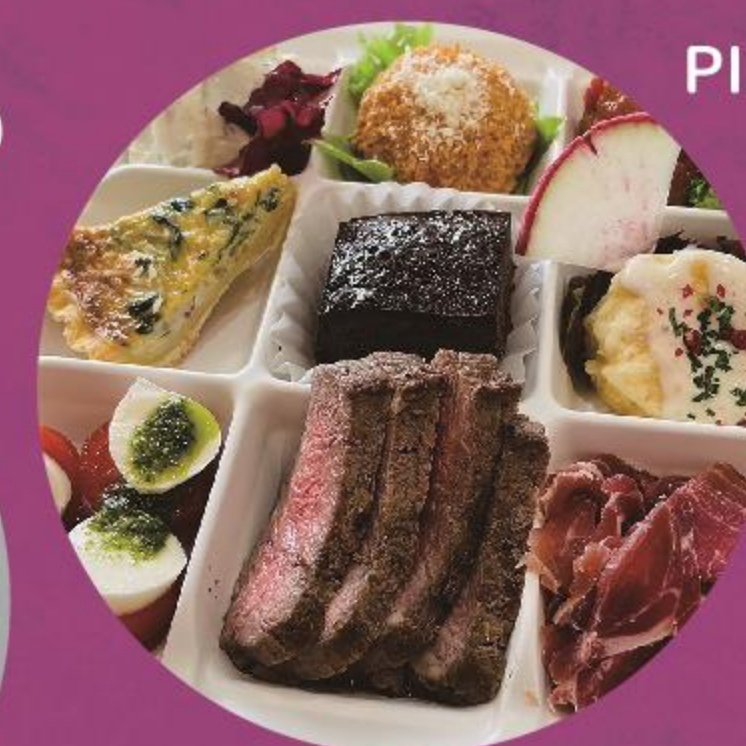
洋食デリリベルタ (洋風惣菜)