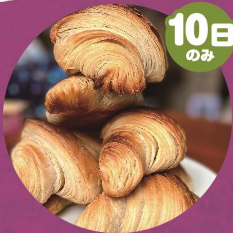
ちいさなしあわせパン☆ (パン)