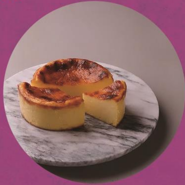
pâtisserie Shu (スイーツ)