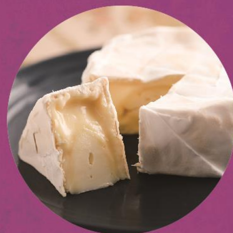
八雲チーズ工房 (チーズ)