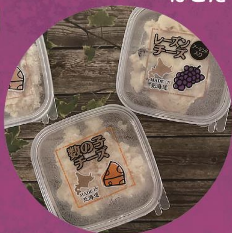
ま印水産 (チーズ等)