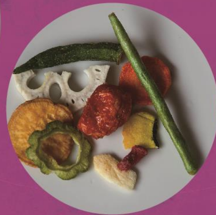
T's smoke (燻製惣菜)